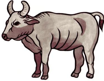
Cara de un becerro